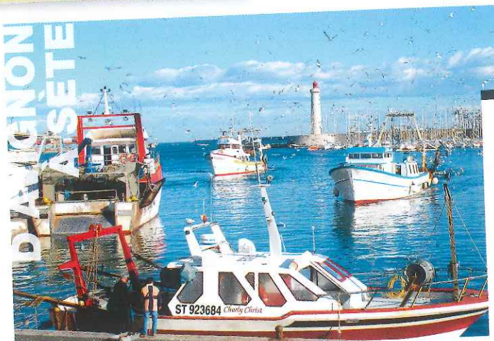
Ville de Sète