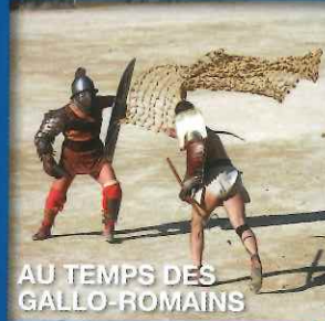
AU TEMPS DES GALLO-ROMAINS