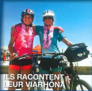
ILS RACONTENT LEUR VIARHÔNA