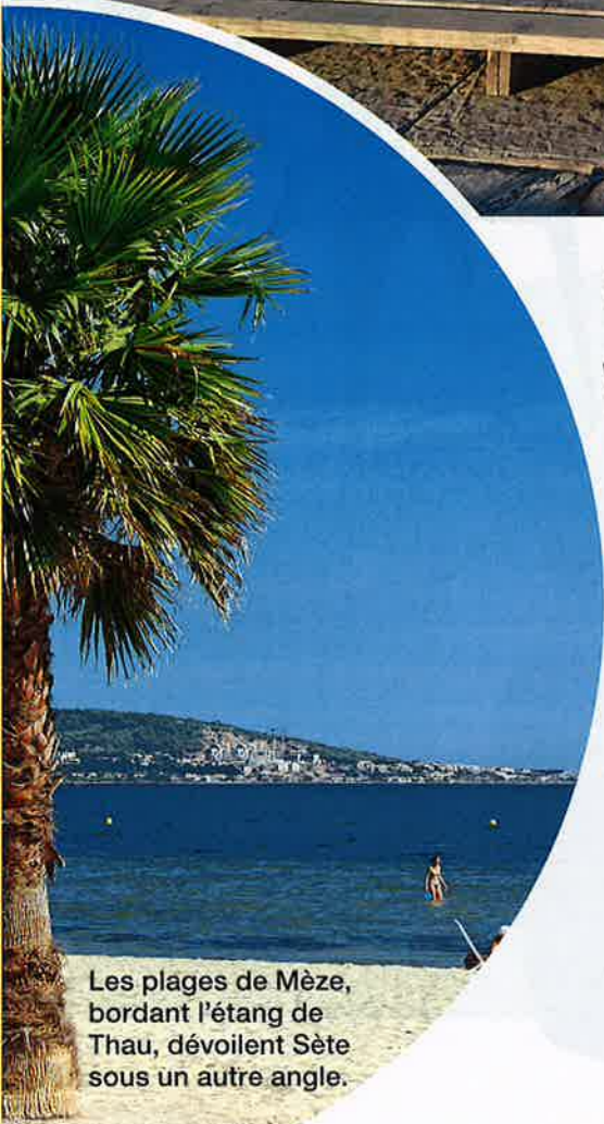
Les plages de Mèze, bordant l'étang de Thau, dévoilent Sète sous un autre angle.