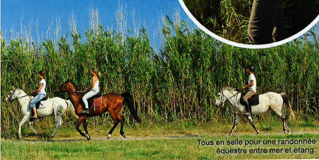
Tous en selle pour une randonnée équestre entre mer et étang.

Georges Brassens. Au restaurant-cabaret « Les Amis de Georges », on fredonne volontiers les chansons du poète. Tous les premiers dimanches de chaque mois, place de la République, les mini-concerts des puces musicales rendent hommage à l'artiste.