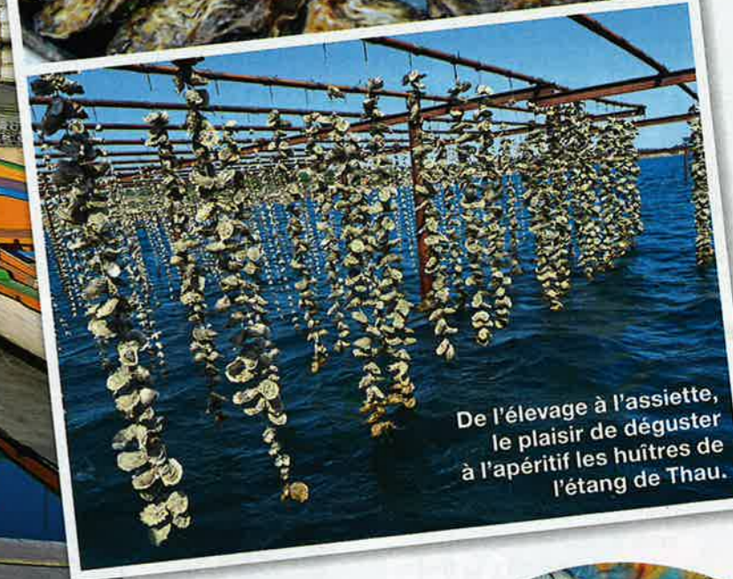
De l'élevage à l'assiette, le plaisir de déguster à l'apéritif les huîtres de l'étang de Thau.