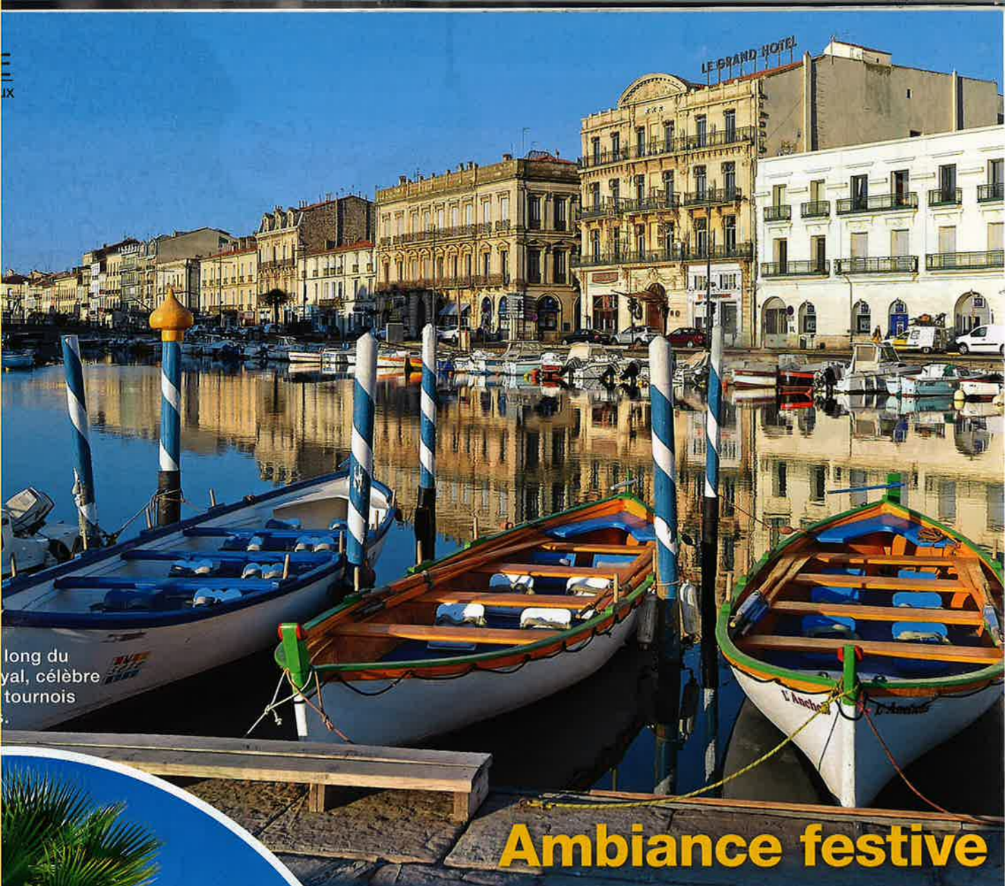
long du yal, célèbre tourois