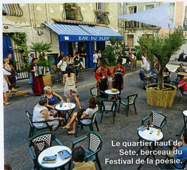
Le quartier haut de Sète, berceau du Festival de la poésie.

L'esprit sétois rime en effet avec fête et culture. En témoignent le théâtre à ciel ouvert, un parcours créatif, avec plus d'une trentaine de murs peints, des ateliers situés dans le quartier haut, une saison complète de concerts et festivals, des joutes nautiques... Bref, le temps d'un été reste un peu court pour faire le tour de Sète, surnommée aussi l'île Singulière.