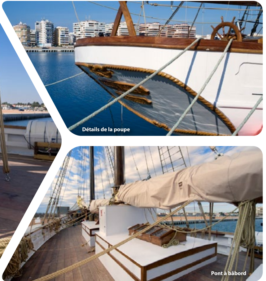
Détails de la poupe