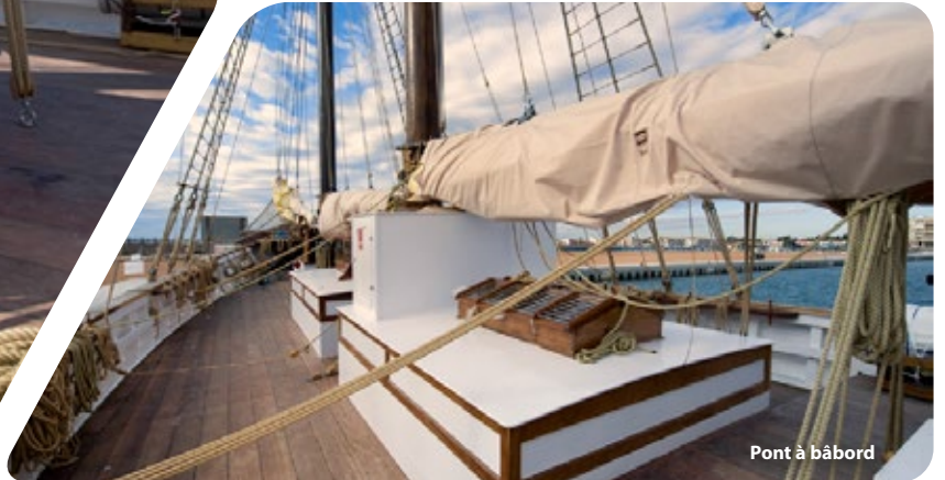
Pont à bâbord